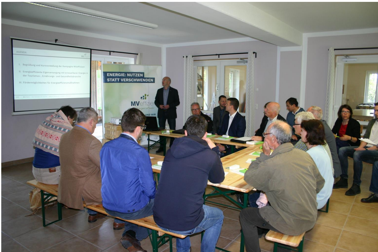
BU: Unternehmer informieren sich beim MVEffizient-Stammtisch im Ferienpark Seehof zum Thema Eigenversorgung mit erneuerbaren Energien

Weitere Informationen unter www.mv-effizient.de