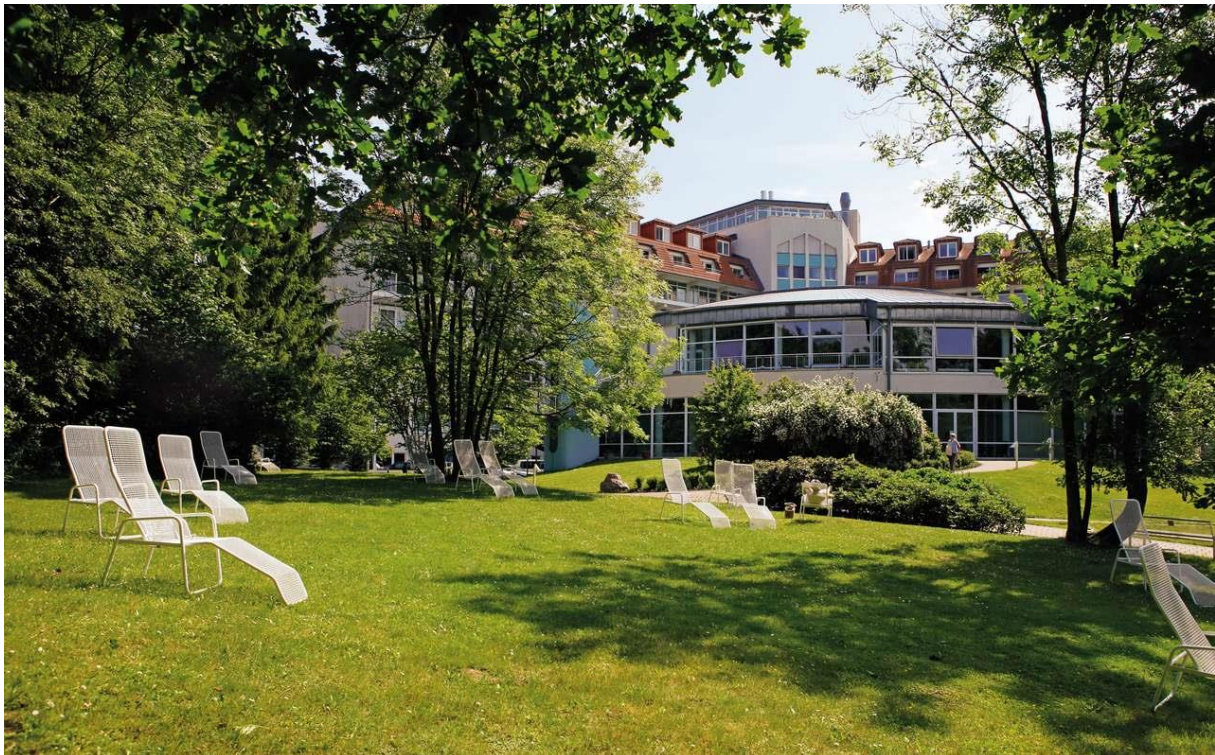
BU: Die Fachklinik will in Zukunft noch weitere Energieeinsparpotentiale nutzen, z. B. bei der Moor-Aufbereitung