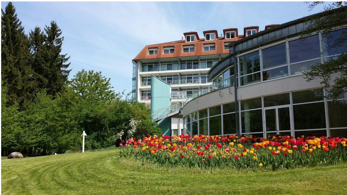
BU: Derzeit versorgen zwei effiziente Blockheizkraftwerke das Moorbad Bad Doberan mit Wärme und Strom

Weitere Informationen unter www.mv-effizient.de