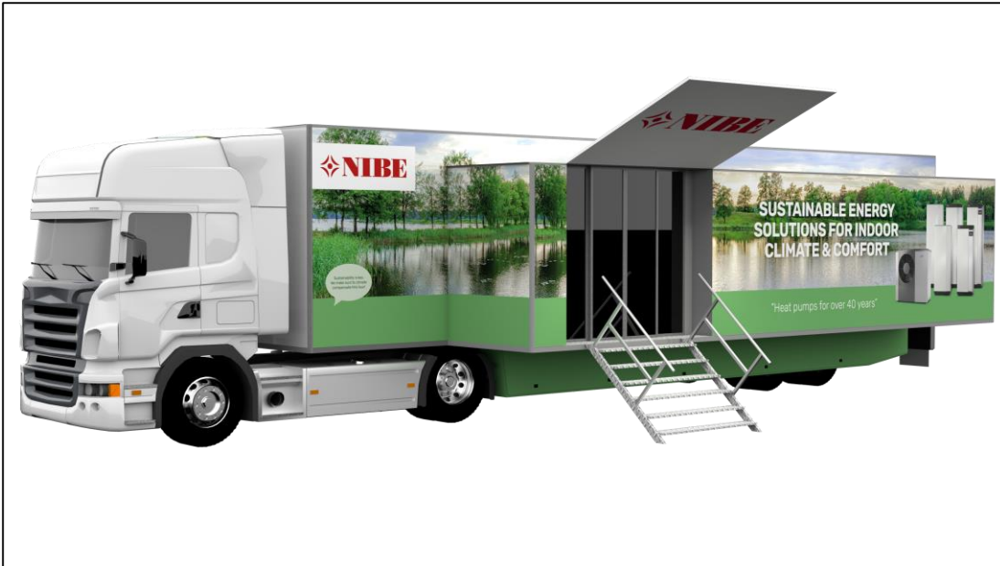
BU: Der Show-Truck des Wärmepumpenherstellers NIBE ist mit der neuesten Wärmepumpen-Technik bestückt.