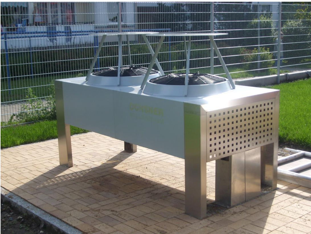
BU: Beispiel einer Luftwärmepumpe für die gewerbliche Nutzung.