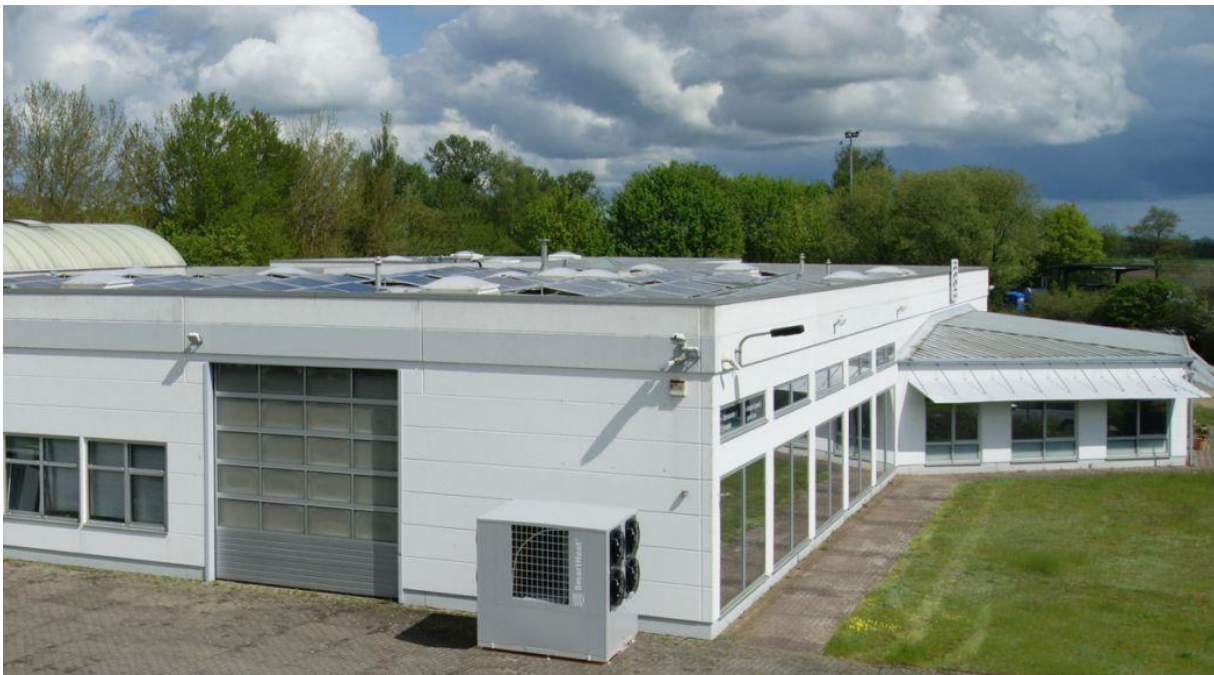
BU: Auch Alt- und Bestandsbauten müssen bis 2045 klimaneutral mit Wärme und Strom versorgt werden, z. B. mit Wärmepumpe und Photovoltaik-Anlage